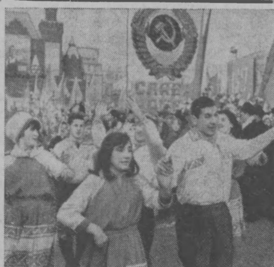
Москва, 7 ноября 1966 года. Празднование 49-й годовщины Великой Октябрьской социалистической революции.

На снимках: слева — парад войск Московского гарнизона на Красной площади, идут зенитные ракеты; справа — демонстрация представителей трудящихся на Красной площади.