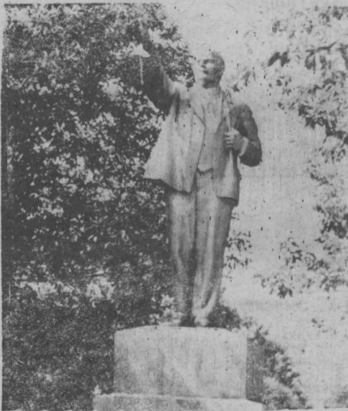
Тоншаевский парк. Памятник В. И. Ленину.

Редакции газеты «Тоншаевский колхозник» систематически освещать ход проведения месячника сада.