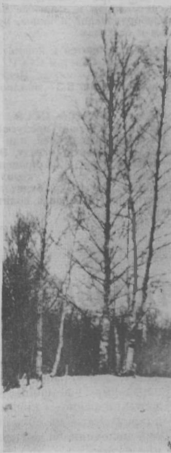
На опушке.

смущения тоном. — Остальные я вам сейчас подберу. С этими словами она подошла ко второму столу, на котором лежал большой ворох неподшитых газет и стала быстро перебирать. Через некоторое время нужные газеты (за целых полмесяца) были найдены и, положив их перед читателем, миловидная женщина, покинув читальный зал, вернулась к своему рабочему месту.