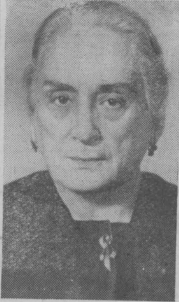
Долорес Гомес Ибаррури, председатель Испанской компартии, верный друг Советского Союза.