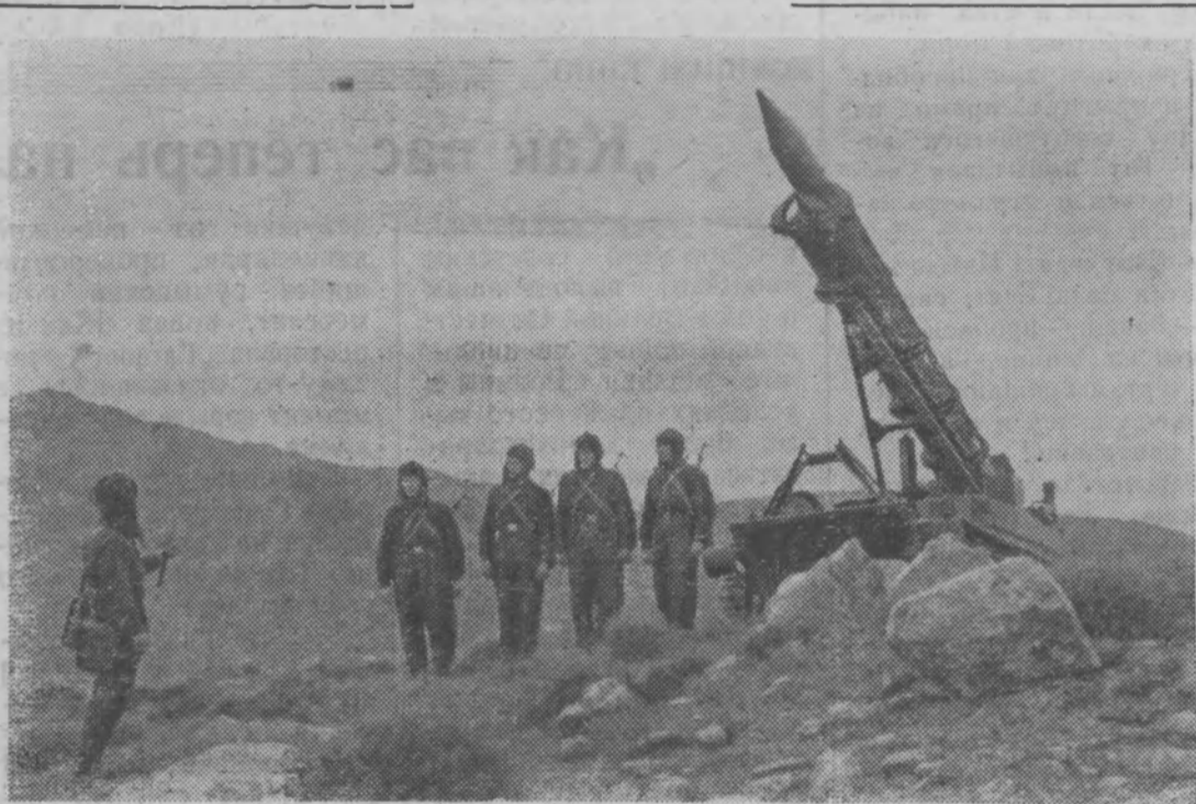
На снимке: командир ракетной установки ставит задачу расчету.