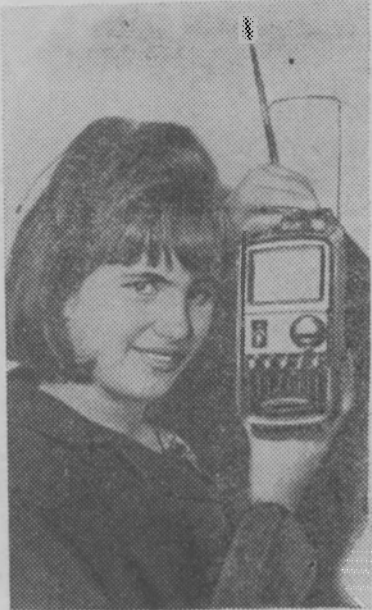
Париж. В столице Франции открылась выставка продукции радиотехнических фирм. На выставке экспонируется много образцов современных радиоприемников и телевизоров.

На снимке: один из самых малогабаритных телевизоров в мире. Питание от одной батареи обеспечивает бесперебойную работу телевизора в течение 15 часов. Вес вместе с батареей—5,9 фунта (примерно 2,5 кг.).