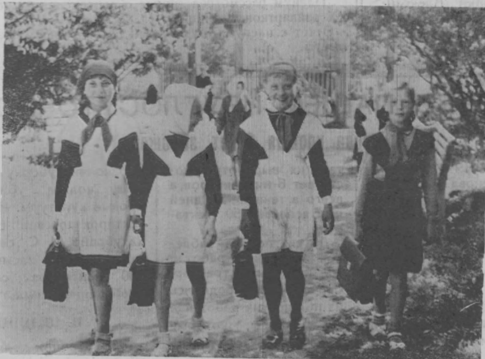
Ученицы спешат в школу.