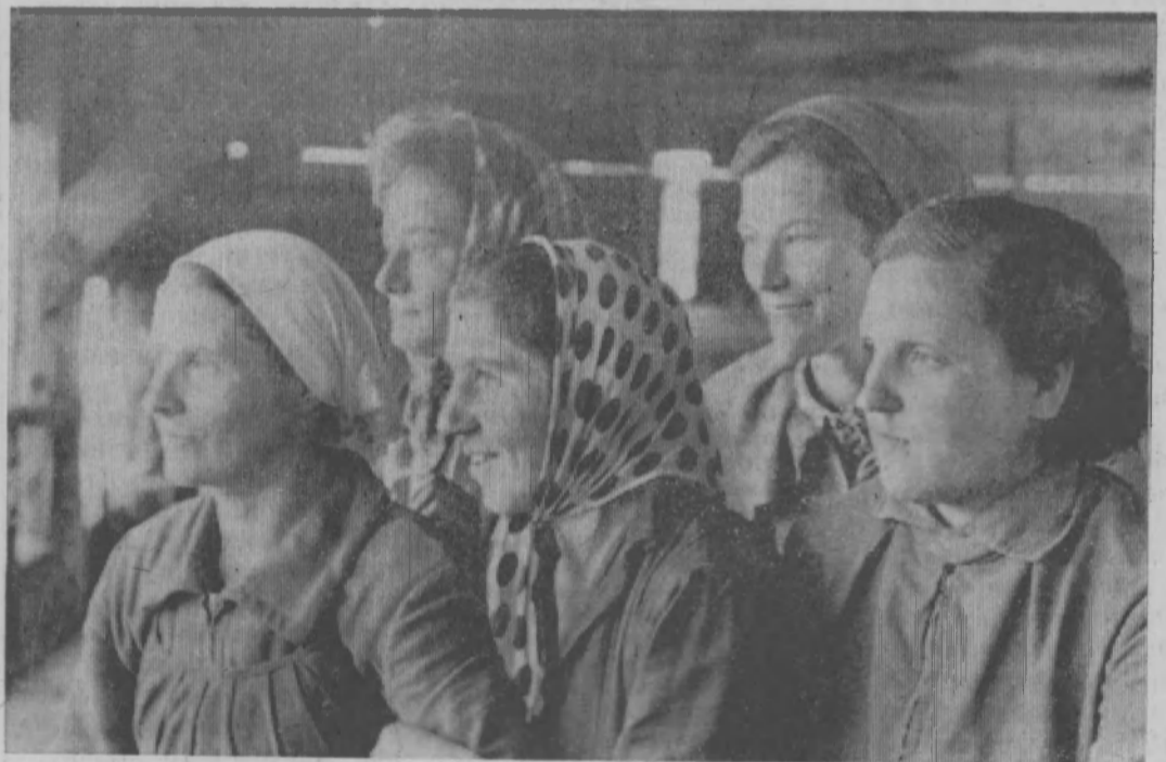
Сотни кубометров пиломатериалов ежедневно проходят через руки сортировщиц лесозащита № 1 Пижемского леспромхоза. Экспортные материалы идут в Англию, Голландию, Венгрию и другие страны Европы.

Так отзываются простые советские люди о труде медработников наших больниц.