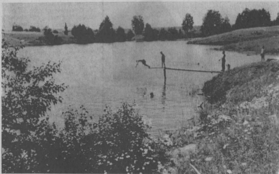
Гагаринский пруд—любимое место отдыха колхозников сельхозартели «Малокаменский».

На экране Тоншаевского Дома культуры киноповесть будет демонстрироваться 24—25 июля 1965 года.