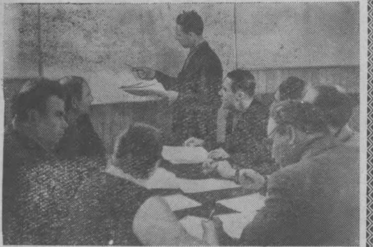
Совхоз имени Димитрова Кустанайской области—хозяйство на освоенной целине.

За пять месяцев нынешнего года я надоила по 673 килограмма молока от каждой из 15 коров моей группы. Надоила немного, конечно. Но скажу прямо: если