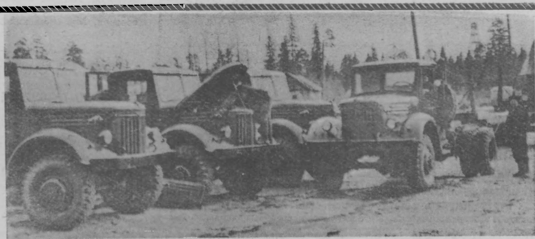
ВАХТАНСКИЙ ЛЕСПРОМХОЗ. На Вараншинский лесопункт поступила новая техника—автомобили «МАЗ-501».

Мартовский Пленум ЦК КПСС наметил неотложные меры по дальнейшему развитию сельского хозяйства. Стабильный план закупок, повышение цен на зерно, надбавки к действующим ценам на мясо открывают перед колхозами и совхозами широкие возможности для рациональной организации производства, позволяют всем колхозам обеспечить высокую рентабельность каждой отрасли.