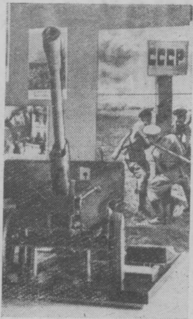
МОСКВА. К 20-летию победы над фашистской Германией открыт Центральный музей Вооруженных Сил СССР.