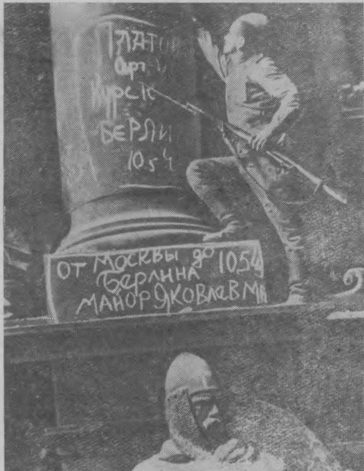
Солдат-победитель расписывается на колонне рейхстага.