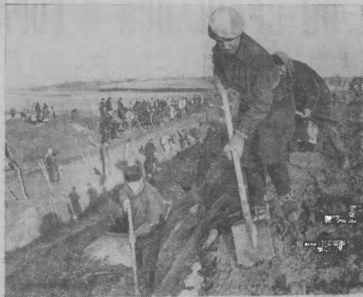
Москва. Октябрь 1941 года. Москвичи на сооружении оборонительных укреплений на западной окраине столицы.