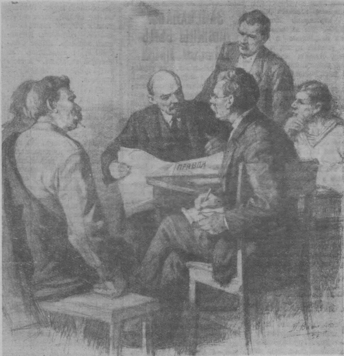
В. И. Ленин беседует с рабочими корреспондентами.

Сегодня, в день советской печати, мы поздравляем рабочих и сельских корреспондентов, всех наших читателей с праздником, призываем еще активнее участвовать в печати, чтобы газета стала боевым помощником районной партийной организации, настоящим пропагандистом, агитатором и организатором масс.