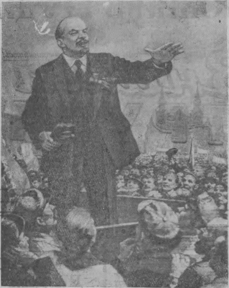
Выступление Ленина на Красной площади в Москве. Рис. П. Васильева.