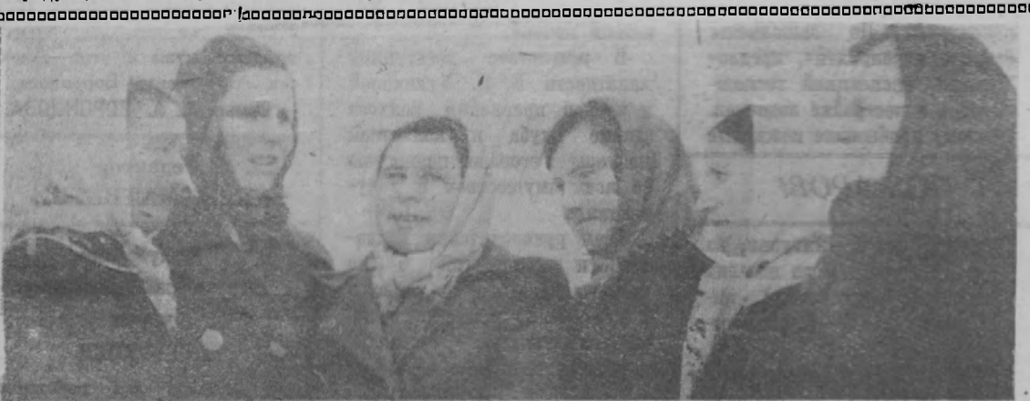
Шарская ферма колхоза «Всходы Ильича» носит высокое звание коллентива коммунистического труда.