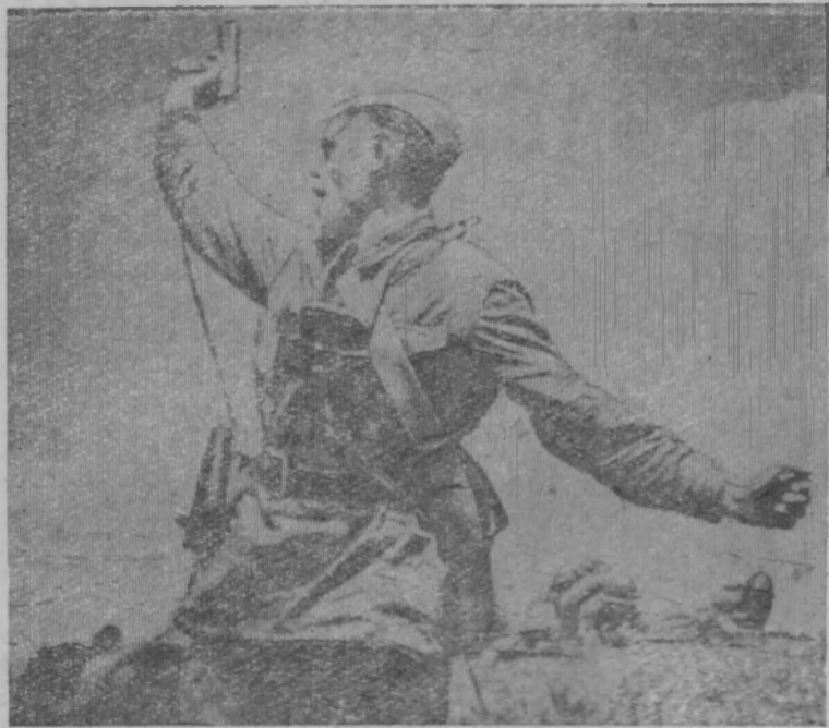
— В атаку!—сказал командир. Фото первых дней войны.