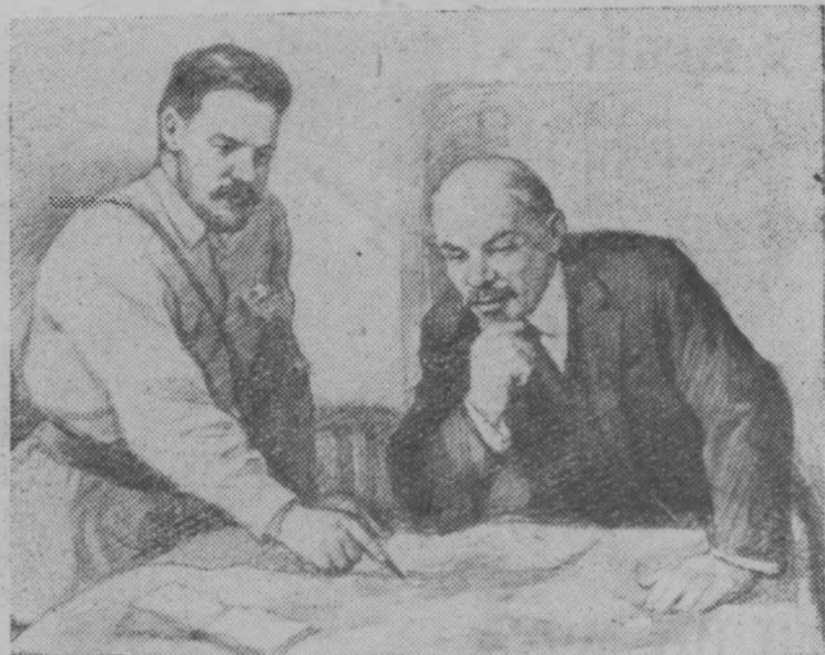
В. И. Ленин слушает доклад М. В. Фрунзе (1920 г.).