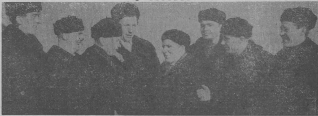
НА СНИМКЕ: бригада механизаторов колхоза «Новый путь».