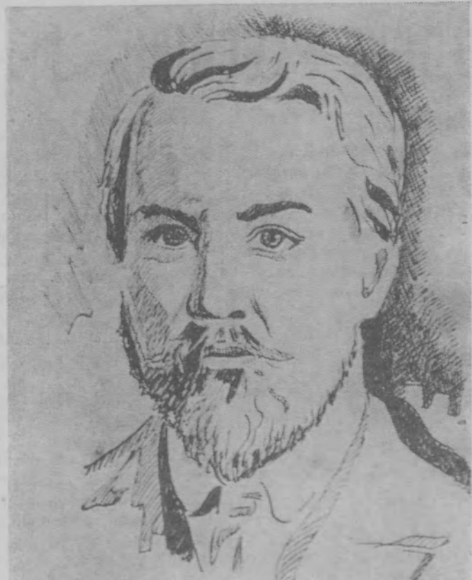
В. А. Серов. Рис. А. Втюрина.