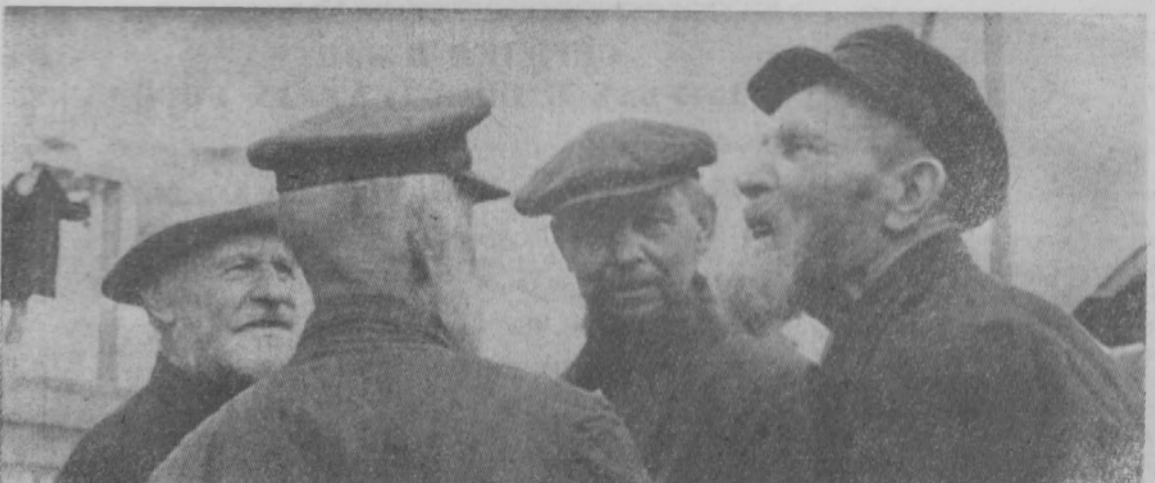
НА СНИМКЕ: группа ветеранов труда колхоза «Заря».