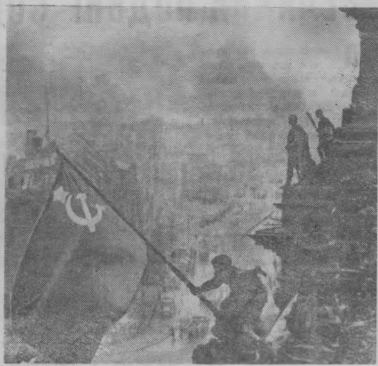
«Знамя победы над рейхстагом».

И. ПАРФЕНОВ, бригадир Крутогорской комплексной бригады колхоза «Герой труда».