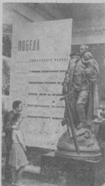
На снимке: в одном из залов музея, посвященном победе Советского Союза в Великой Отечественной войне.