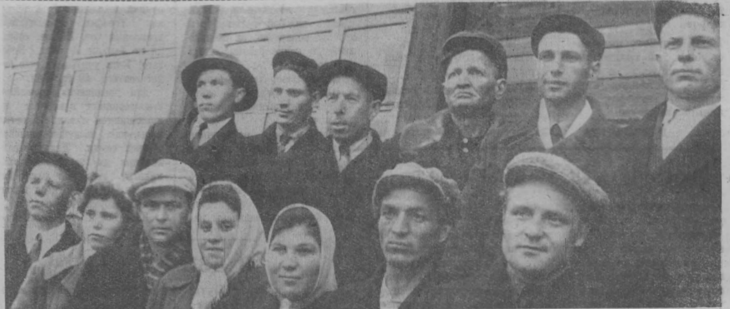
Семилетку—досрочно!—под таким лозунгом трудится коллектив Пижемского леспромпхоза. В авангарде борьбы за успешное выполнение обязательств идут разведчики будущего. Вы видите на этом снимке группу ударников коммунистического труда леспромпхоза.