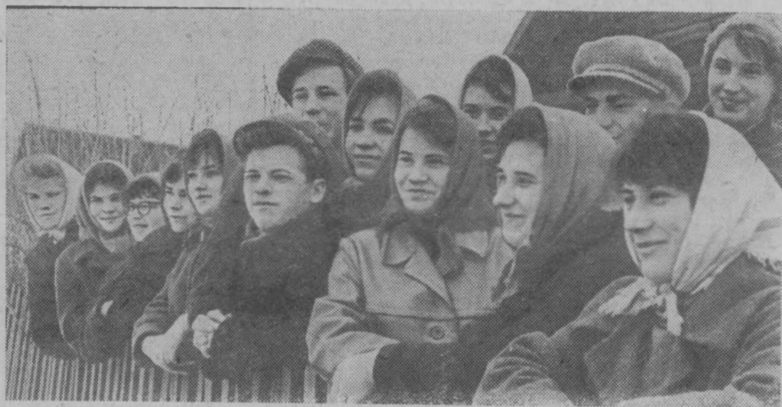
Калининская область. Учащиеся 11-го класса Медновской средней школы решили остаться работать в родном совхозе «Медновский». В открытом письме, опубликованном в местных газетах, они заявили, что будут трудиться на полях и животноводческих фермах, везде, где нужны их молодые руки.

К РАСНОГОР. Совместно с партийной организацией колхоза «Новый путь» члены совета клуба, агитаторы и активисты проводят беседы, читки газет, рассказывают о ближайших задачах колхоза и бригад. При клубе работает библиотека на общественных началах. Ее постоянно посещают около 100 читателей — механизаторов, работников животноводства.