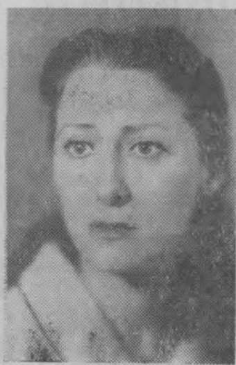
М. М. Плисецкая