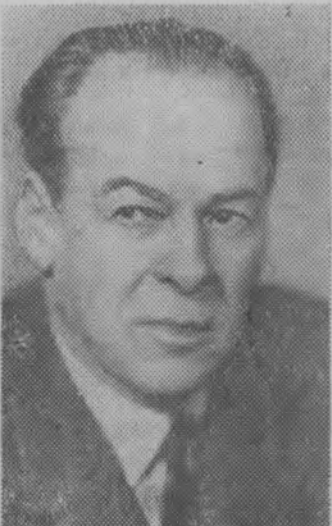
Н. К. Черкасов