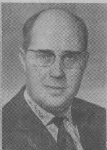
М. Л. Ростропович