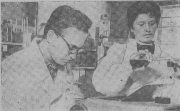
Агрохимическая лаборатория Брянской областной сельскохозяйственной опытной станции оснащена новейшими приборами, которые позволяют быстро и точно производить анализы почв и растений, необходимые для составления картограмм.

Бюро ЦК КПСС по РСФСР одобрило инициативу коллективов предприятий металлургической и угольной промышленности Свердловской, Кемеровской областей и Красноярского края.