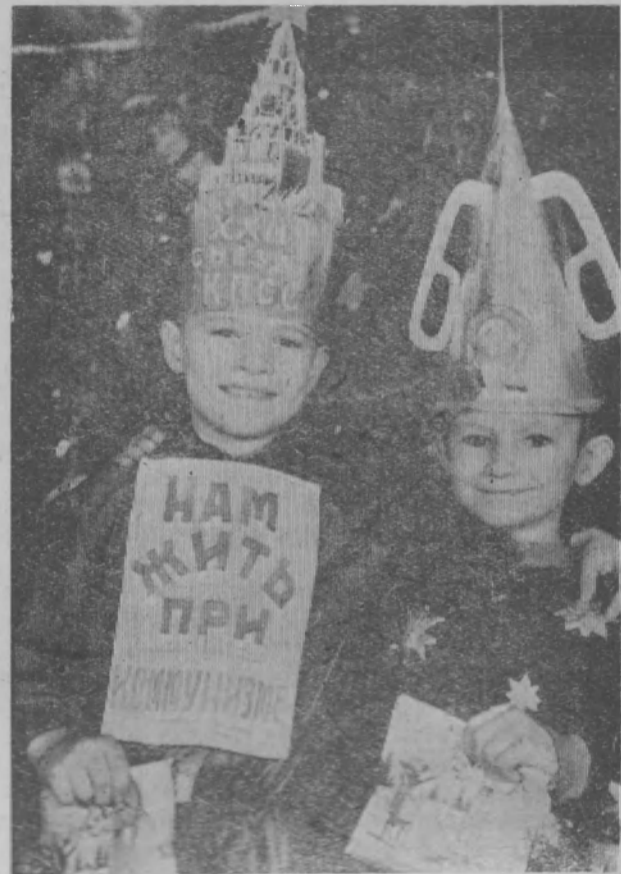
Новые костюмы.