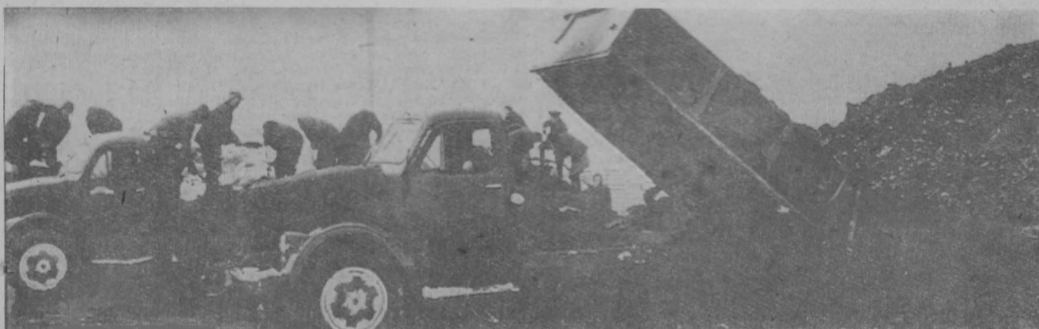
Каждая ферма в колхозе «Новый путь» превращена в фабрику удобрений. Только нынешней зимой здесь механизаторы заготовили торфяноазотных компостов свыше 20 тысяч тонн. НА СНИМКЕ: механизированный отряд колхоза за разгрузкой торфа у Мартянинской фермы.