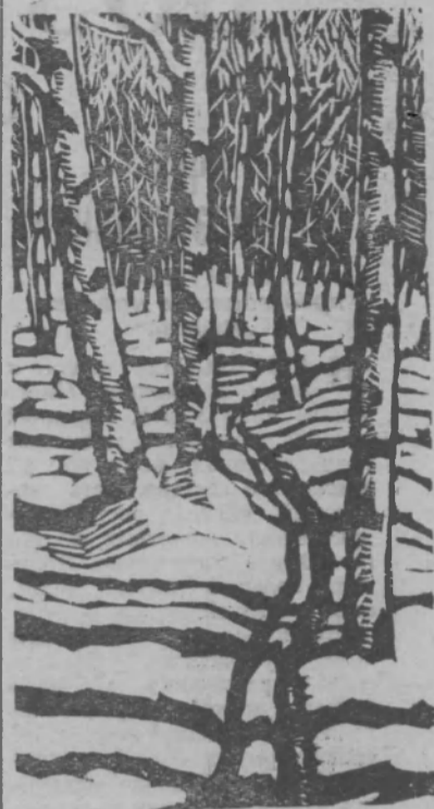
Рисунок Ю. ШИШМАКОВА.