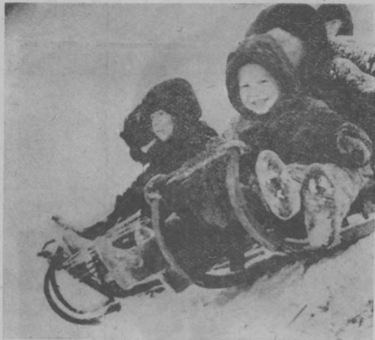
По первому снегу.