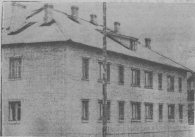
С каждым годом растет и благоустраивается Сява — поселок лесохимиков, добытчиков живицы и лесозаготовителей. НА СНИМКЕ: новый 8-квартирный жилой дом на Советской улице.