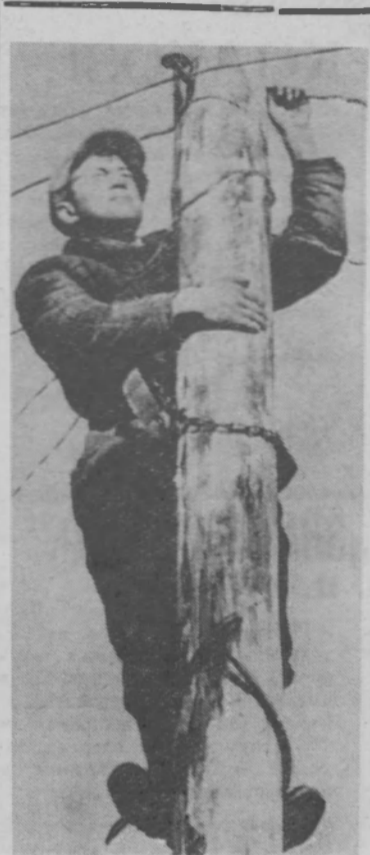
Электричество все больше входит в быт и труд колхозников сельхозартели «Ударник».