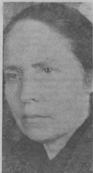
служивать больных, чтобы они быстрее могли встать на ноги.