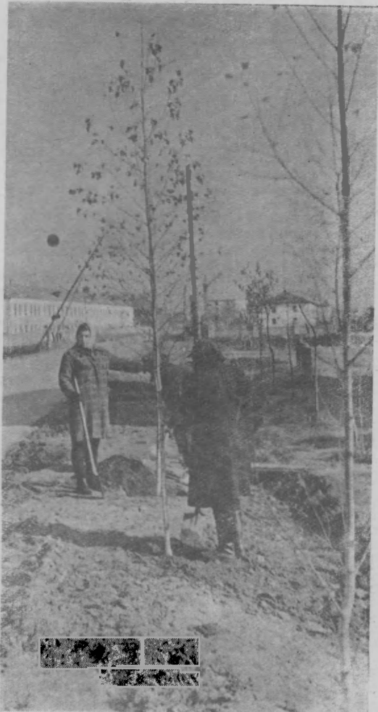
Большую заботу о «зеленом друге» проявляют учащиеся Шахунской средней школы № 1.

В. МАРАЕВ, агроном производствен- ного управления.