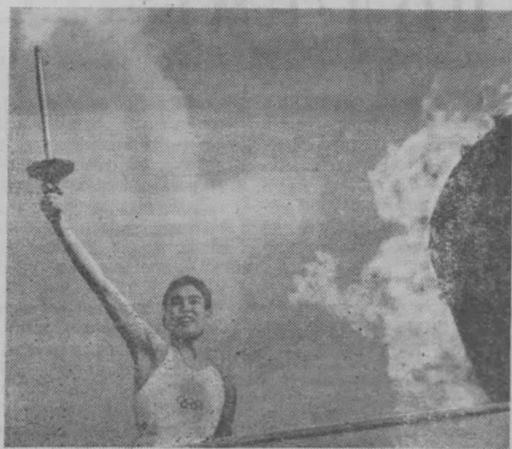
Горит олимпийский огонь!