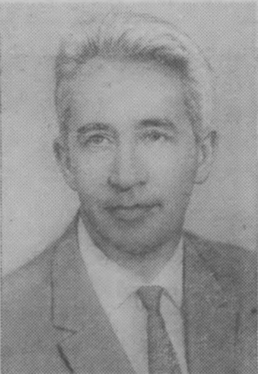
Космонавт ФЕОКТИСТОВ Константин Петрович