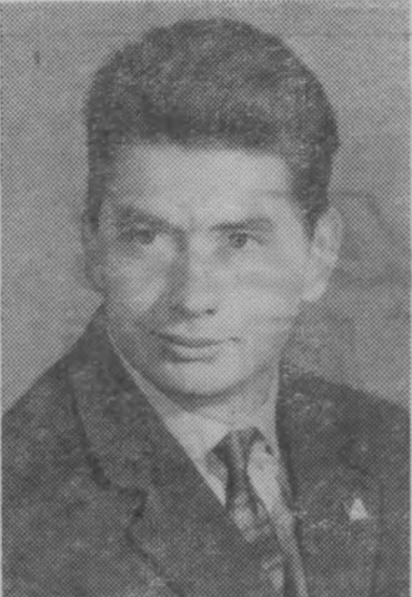
Космонавт ЕГОРОВ Борис Борисович