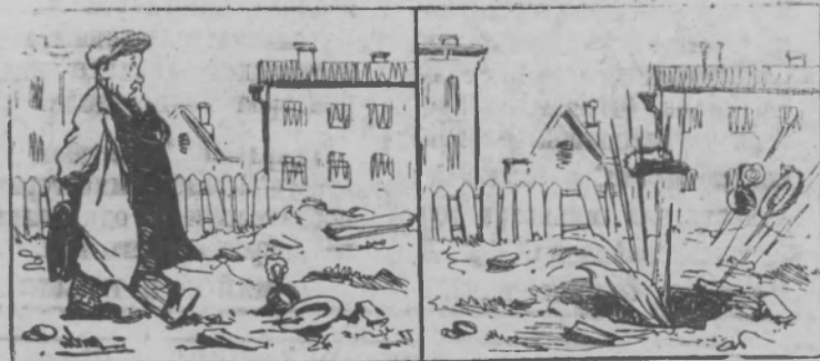
—Где-то здесь должна быть яма