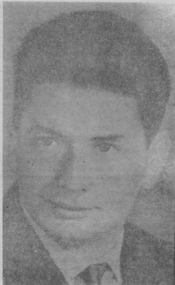
Б. Б. ЕГОРОВ Врач-космонавт