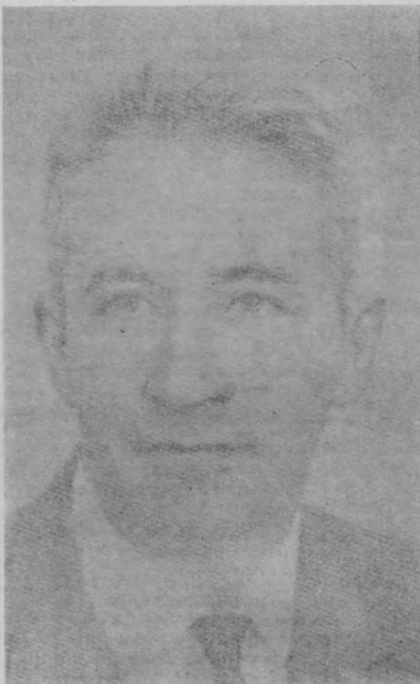
К. П. ФЕОКТИСТОВ Научный сотрудник-космонавт