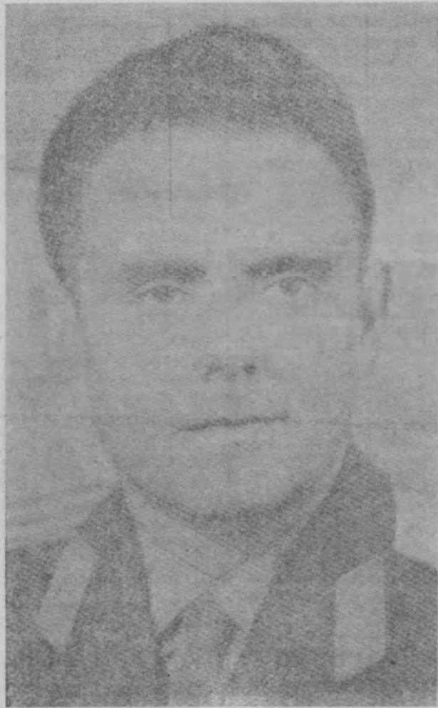
В. М. КОМАРОВ Командир корабля летчик-космонавт

Программа научных исследований, рассчитанная на одни сутки полета, выполнена полностью. Получен ценный материал о полете группы космонавтов, состоящей из различных специалистов. Впервые ученые-исследователи непосредственно проводили наблюдения и изучение космического пространства. Материалы, полученные в результате полета, обрабатываются.