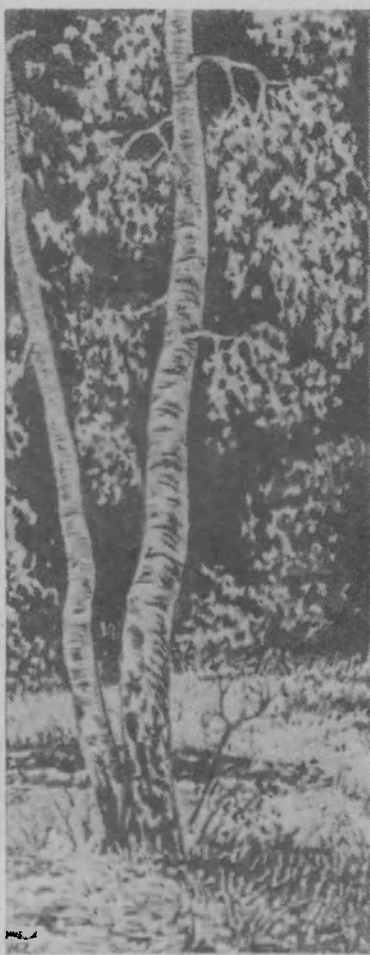
«Осень» Рис. А. Юкляева.