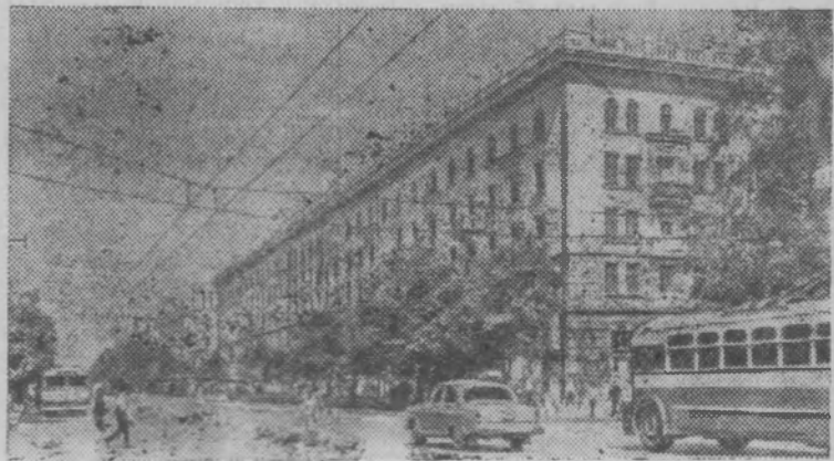
КИШИНЕВ. Проспект Ленина.

● В семи вузах и 37 средних специальных учебных заведениях обучается сейчас 54 тысячи студентов.