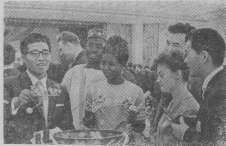
МОСКВА. Всемирный форум солидарности молодежи и студентов в борьбе за национальную независимость и освобождение, за мир.