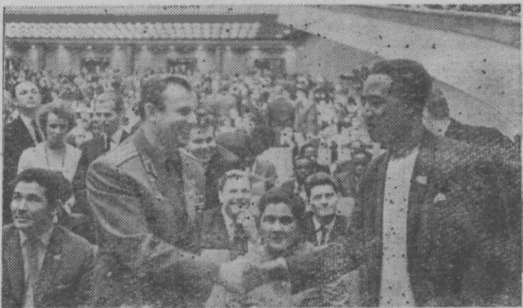
МОСКВА. В Кремлевском Дворце съездов проходит Всемирный форум солидарности молодежи и студентов в борьбе за национальную независимость и освобождение, за мир.