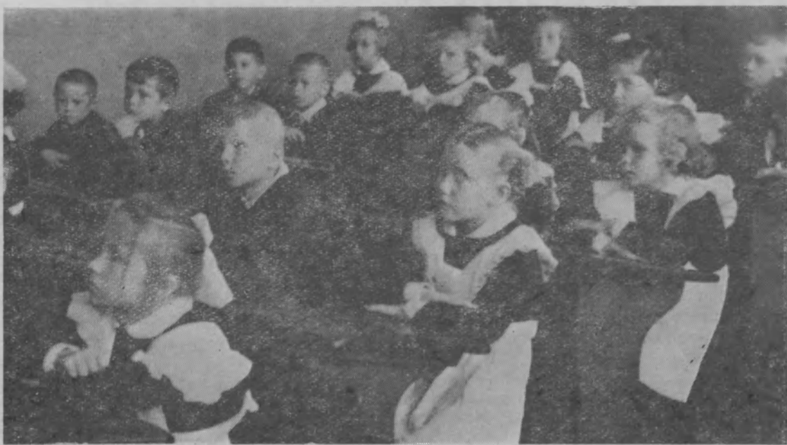
Первые уроки в Шахунской школе № 14