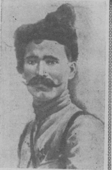
района с большим интересом знакомится со всем, что связано с замечательной, светлой жизнью В. И. Чапаева, стремясь быть по-чапаевски смелыми и преданными партии во всей своей жизни.

Сегодня исполняется 45 лет с того дня, когда в неравном бою с врагами погиб славный народный герой Василий Иванович Чапаев.