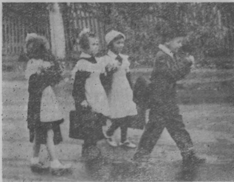
Первый раз в первый класс!