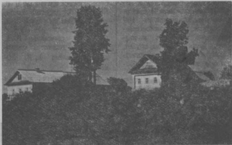
Из года в год хорошеют деревни колхоза «Новый путь». На снимке: вид деревни Дыхалиха.