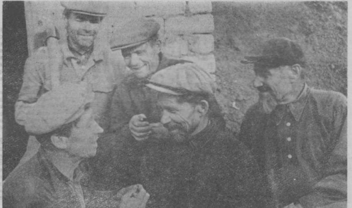
Строительная бригада, состоящая из ветеранов колхоза «Новый путь», к началу уборки урожая закончила строительство овощехранилища.

г. Корсунь-Шевченковский, Черкасская область.