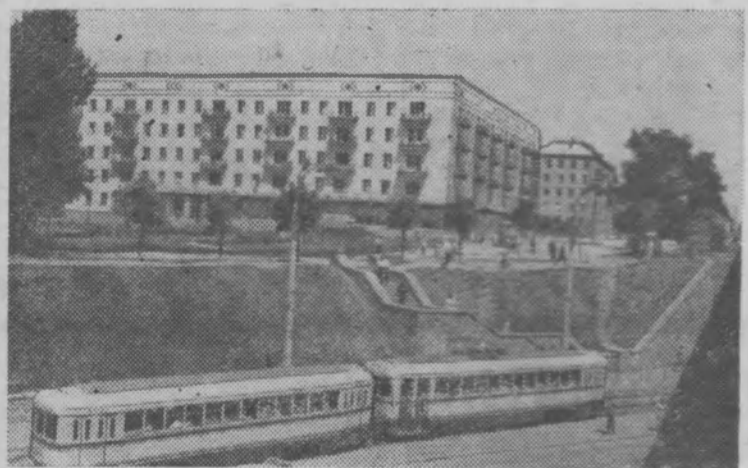
На снимке: жилые дома по улице Лагерная гонта.