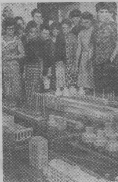
Москва. В Государственном музее революции СССР открыта выставка «Химия на службе коммунизма».

секретарь партбюро Сявского лесохимкомбината.