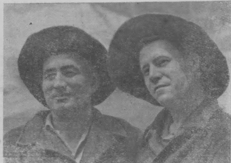
ЮЖНО-КАЗАХСТАНСКИЙ КРАЙ. Тысячи тонн свинца дополнительно к плану разлили металлурги цеха рафинирования, носящего звание коммунистического, на Чимкентском свинцовом заводе.

Вместе с этим, партийные, профсоюзные и комсомольские организации, хозяйственные руководители должны усилить воспитательную работу, помогать каждому труженику производительнее работать, культурно отдыхать, прививать черты коммунистического отношения к труду.