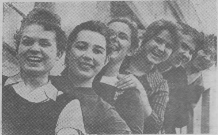
ЧУВАШСКАЯ АССР. Хорошо работает молодежь на Чебоксарском электроаппаратном заводе. Эти девушки монтируют магнитные станции управления, широко известные на стройках семилетки и за рубежом.