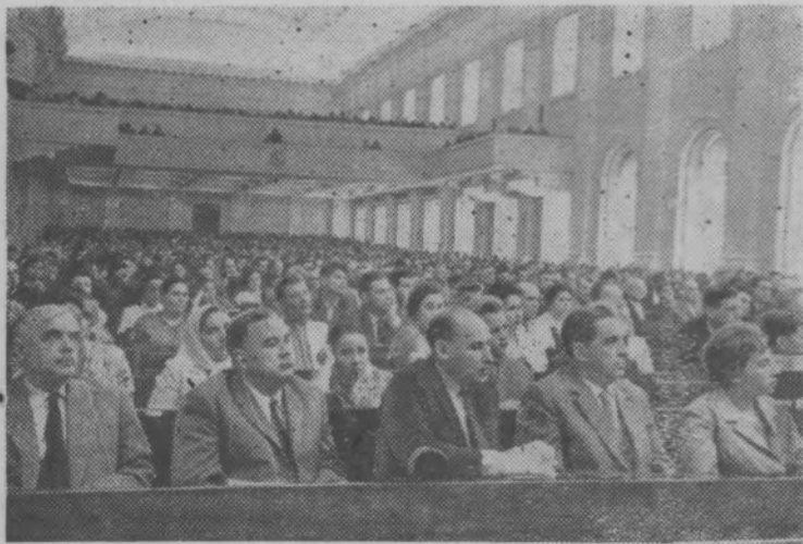
МОСКВА. Четвертая сессия Верховного Совета СССР шестого созыва.

На снимке: во время заседания.