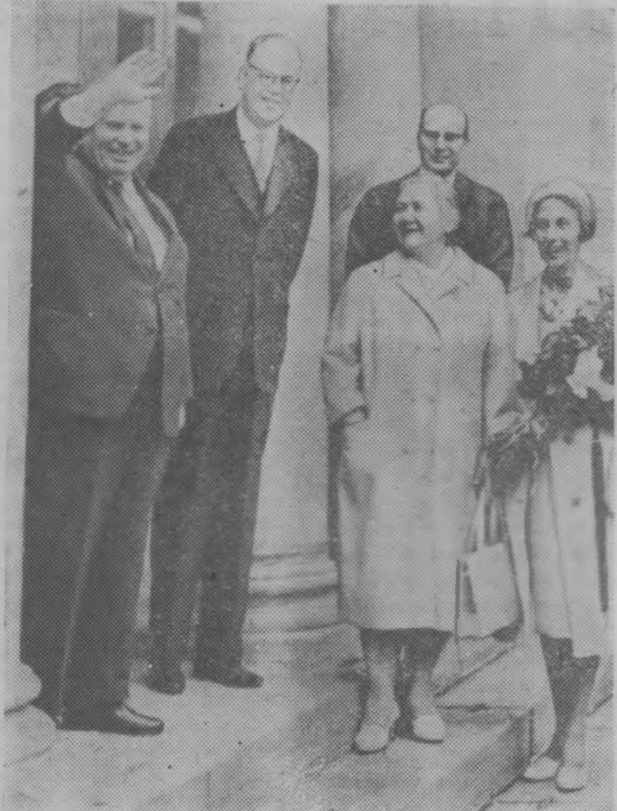
На снимке: Н. С. Хрущев отвечает на приветствия жителей Стокгольма у дворца Хага.