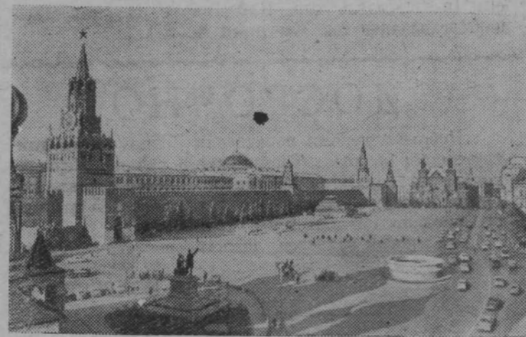
Москва. Красная площадь.