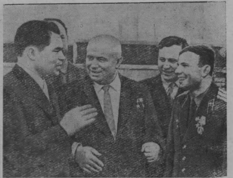
Первый секретарь ЦК КПСС, Председатель Совета Министров СССР Н. С. Хрущев беседует с А. Г. Николаевым, П. Р. Поповичем и Ю. А. Гагаринным. Снимок сделан на приеме в Кремле 14 апреля 1961 года.

Вопрос о ходе уборки и сдаче хлеба государству был рассмотрен на расширенных заседаниях бюро райкомов с участием руководителей производственного управления и парткома обкома КПСС. Бюро строго предупредило тех руководителей колхозов, которые медлят с уборкой и продажей хлеба государству. Рекомендовано принять все меры для завершения уборки и сева озимых, уборки гороха, ячменя и скирдования соломы. Не позднее 5 сентября выполнить план хлебосдачи, широким фронтом вести зяблевую вспашку. Партийным организациям предложено взять под свой неослабный контроль выполнение всех этих работ, усилить массово-политическую работу среди механизаторов и колхозников, шире развернуть соревнование за успешное завершение сельскохозяйственного года.