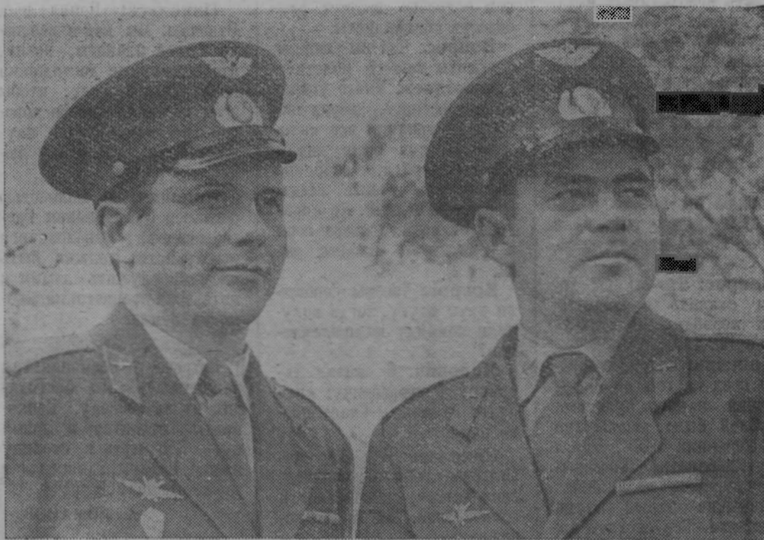
Летчики-космонавты А. Г. Николаев (справа) и П. Р. Попович.