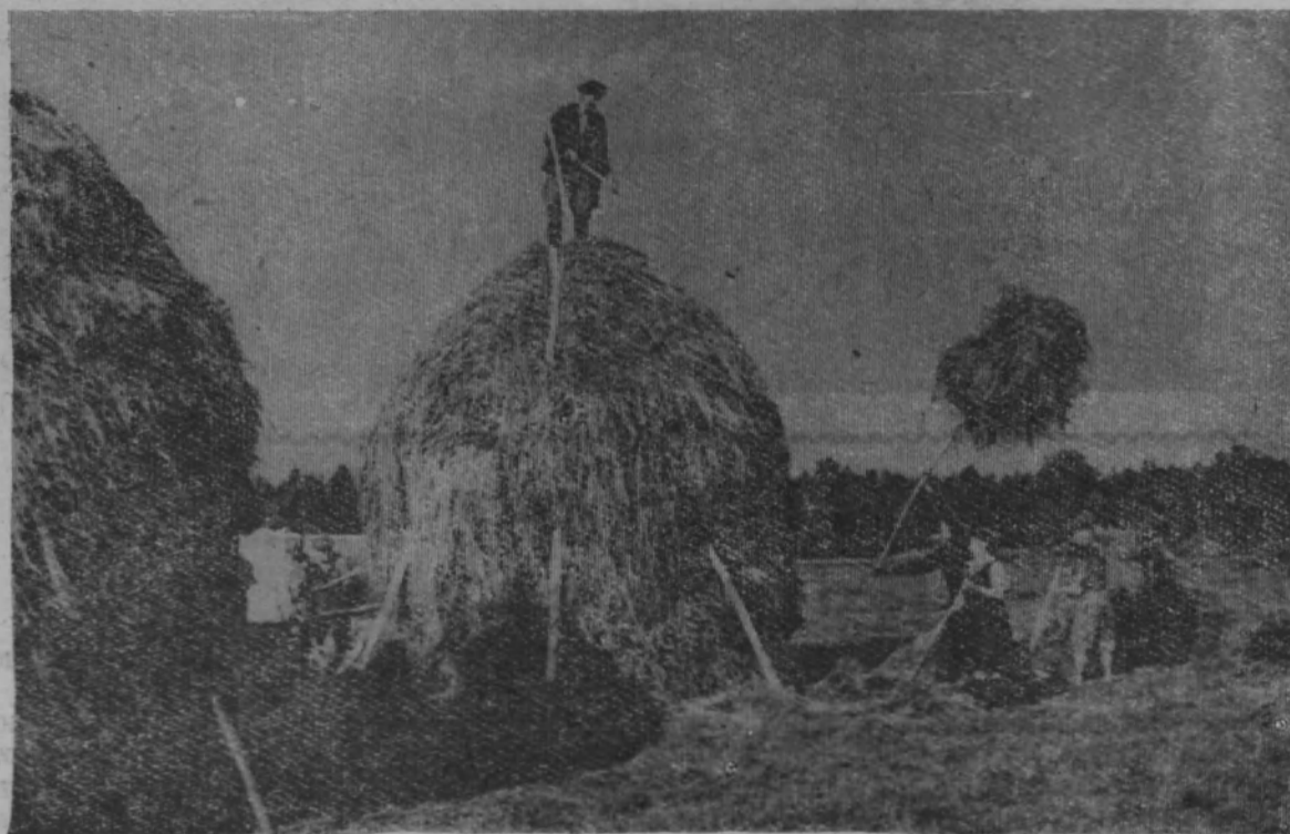
Уборка трав в колхозе «Герой труда».