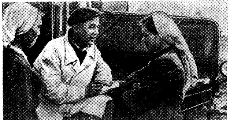
ЧУВАШСКАЯ АССР. Отряды «Комсомольского прожектора» созданы в сельхозартели «Россия» Цивильского района. Молодые колхозники установили неослабный контроль за положением дел в колхозных бригадах и на фермах.

Высокий долг всех партийных организаций, всех коммунистов — использовать сейчас каждый день, каждый час для ухода за посевами пропашных и для подготовки к уборке урожая.