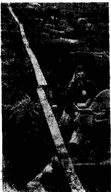
СТАВРОПОЛЬСКИЙ КРАЙ. В опытно-показательном хозяйстве — сельхозартеле «Россия» Ново-Александровского района дойное стадо круглый год находится на стойловом беспривязном содержании.

Сейчас в колхозе ведется косьба озимых на зеленой корм. Скот вволю получает сочные корма и на ферме с каждым днем растут надоя молока. Перевод коров на беспривязное содержание позволил, кроме того, сократить количество работающих на ферме людей и перевести их на другие работы.