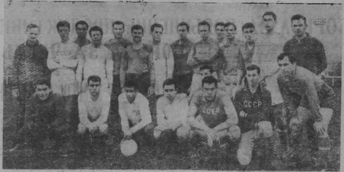
Сборная команда СССР — участница розыгрыша первенства мира по футболу в Чили.